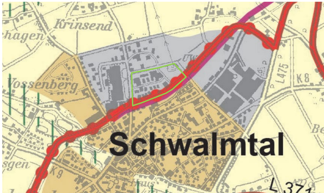
Abbildung 2: Auszug aus dem Regionalplan Düsseldorf; Quelle: Eigene Darstellung nach Bezirksregierung Düsseldorf 2018

Gemäß dem Regionalplan für den Regierungsbezirk Düsseldorf (RPD) liegt das Plangebiet in einem Bereich für Gewerbe und Industrie (GIB) (vgl. Abbildung 2), welches zunächst der Ansiedlung von emittierenden und – sofern dies der Wahrung von Abstandserfordernissen bzw. der Gliederung der Baugebiete dient – nicht emittierenden Industrie- und Gewerbegebieten dient. Insofern kann die beabsichtigt Darstellung bzw. Festsetzung eines „Gewerbegebietes“ als unstrittig erachtet werden. Im Hinblick auf Einzelhandelsvorhaben wird im Ziel 1 zu den GIB u.a. wie folgt ausgeführt: