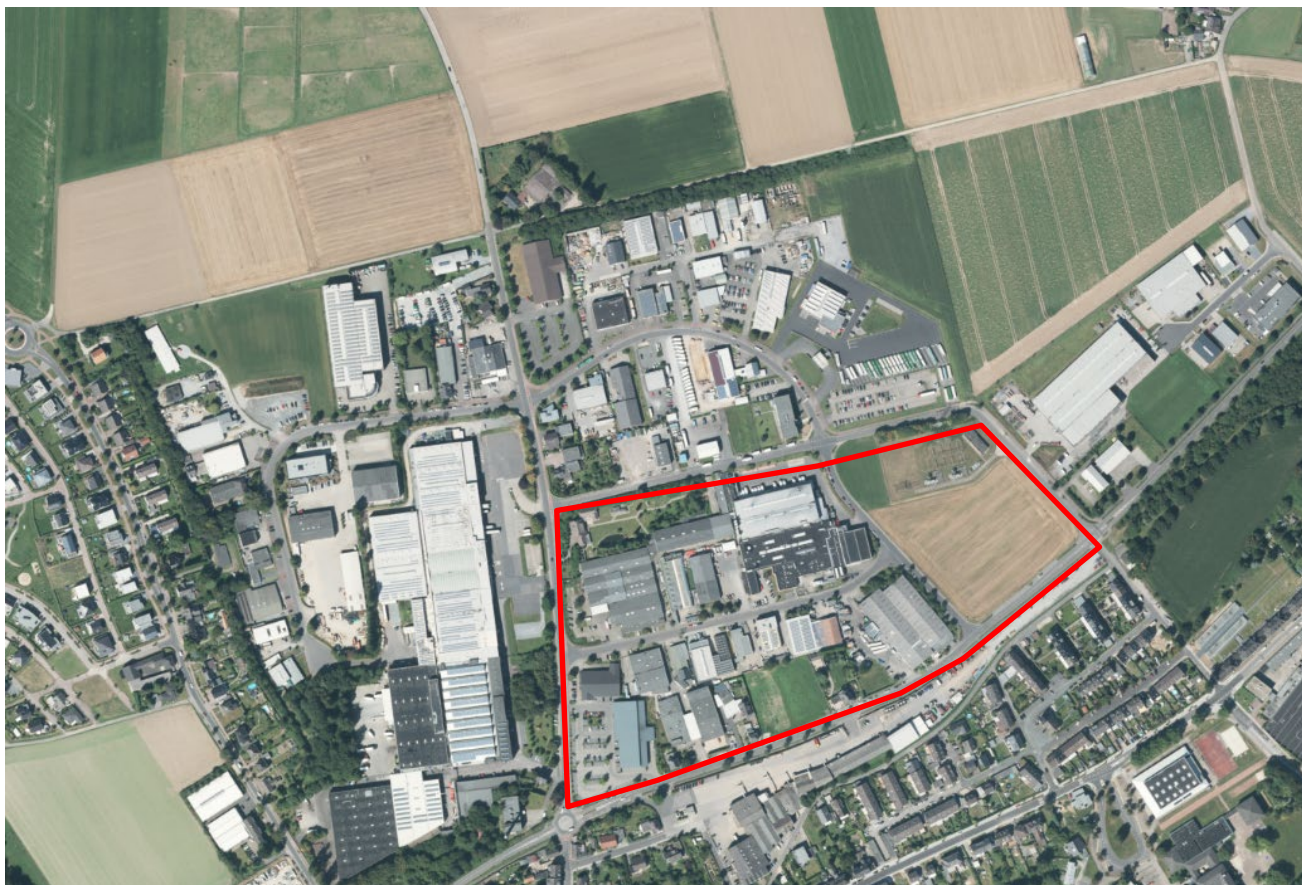
Abbildung 1: Luftbild des Plangebietes und dessen Umgebung; Quelle: Eigene Darstellung nach Land NRW 2018

Das Plangebiet umfasst die Grundstücke Gemarkung Waldniel, Flur 46, Flurstücke 191, 192, 193, 194, 199, 200, 208, 233, 237, 238, 241, 242, 243, 244, 248, 256, 257, 259, 265, 271, 272, 292, 294, 317, 318, 329, 337, 368, 388, 389, 495, 496, 497, 586, 587, 605, 646, 647, 648, 675, 683 und 684 und damit eine Fläche von rund 12 ha. Das Plangebiet ist im Norden, Osten, Süden und Westen von weiteren gewerblich genutzten Bauflächen umgeben. Im Norden und Osten wird es begrenzt von der Straße Auf dem Mutzer. Im Süden befindet sich die Industriestraße. Westlich umschließt der Vogelsrather Weg das Plangebiet.